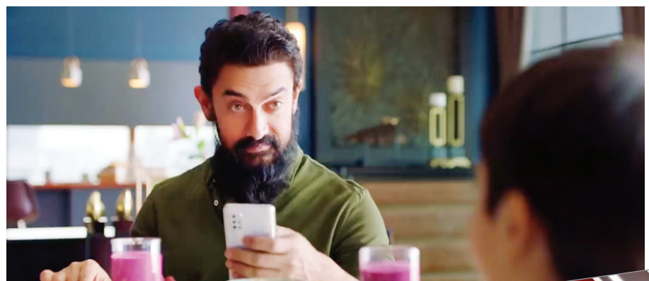
In new campaigns, Aamir Khan (above) asks people to switch off their phones for quality family time and Sara Ali Khan (right) talks about style

Having registered a sharp increase in market share in 2019, the Chinese smartphone brand looks to raise the game